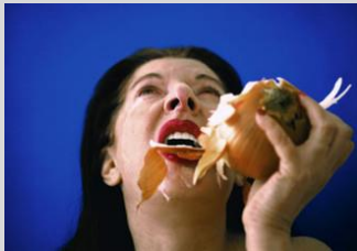
The Onion (2005), Marina Abramovic