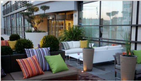
Terrasse de l'Hôtel Renaissance Aix

En compagnie de votre guide-conférencier, promenade vers le centre historique d'Aix-en-Provence.