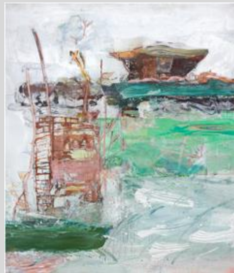
« Paysage » 2013 - Chantalpetit