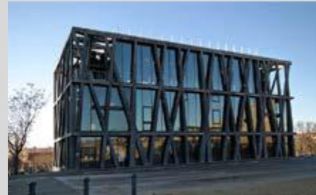
© Pavillon Noir – Ballet Angelin Preljocaj

Chemin faisant, découverte extérieure des nouveaux lieux du forum culturel aixois conçus par les prestigieux Kengo Kuma, Rudy Ricciotti, Vittorio Gregotti et Paolo Colao.