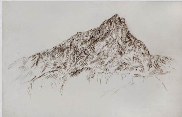
« Sainte Victoire » - Yazid Oulab