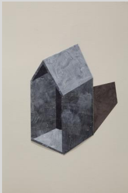
Suspension - Piotr Klemensiewicz

Promenade sur le Cours Mirabeau et dans le quartier Mazarin , où vous pourrez admirer les façades des somptueux hôtels particuliers, symboles et témoins de l'histoire de la cité.