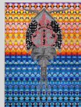
«Protozoaire» - 2013, Antonin Heck

Grand Midi fédérés autour d'une même thématique, celle du dessin contemporain et de ses explorations multiformes.