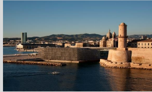
MuCEM - Lisa Ricciotti © MuCEM

Visite des collections temporaires ou permanentes. La Galerie de la Méditerranée est articulée autour de quatre thèmes caractéristiques des sociétés méditerranéennes, du Néolithique à l'époque contemporaine.