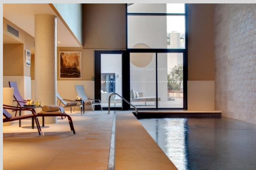
Spa Ymalia – hôtel Renaissance Aix

Accès libre au Spa Ymalia de l'hôtel (hors soins) pendant la durée de votre séjour.